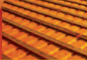
ISI VE SU YALITIMLI ÇATI