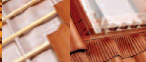
NEFES ALAN ÇATI