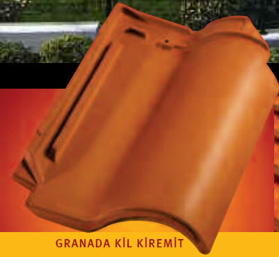
GRANADA KİL KİREMİT