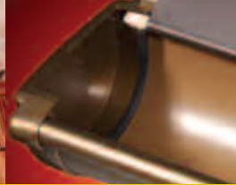
DETAY ÇÖZÜMLERİ MÜKEMMEL ÇATI